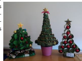
Árvores vencedoras (da esq. para a dta: 2º, 1º e 3º lugares)

Os pais e encarregados de educação foram convidados a visitar a exposição e tiveram oportunidade de votar nos seus trabalhos preferidos. Os resultados da votação serão divulgados no blogue das Bibliotecas AESA.