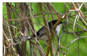
Toutinegra-de-cabeça-preta ( Sylvia melanocephala )

A melodia das vocalizações e a expressividade dos movimentos da avifauna conjugadas à harmonia de cores e de aromas da vegetação mediterrânica tornam o logradouro num local aprazível e que, atendendo aos valores naturais que alberga, merece ser valorizado, sendo um local com potencialidades, para a promoção de atividades letivas em determinadas matérias, de extensão curricular, e, sobretudo, de educação ambiental.