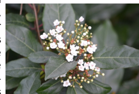
Folhado ( Viburnum tinus )

O sucesso de reflorestação foi elevado e, decorridos cerca de 14 anos, podemos encontrar uma pequena "mata" mediterrânica (na realidade da estrutura vegetal um maquis) que reúne condições alimentares, de abrigo e de reprodução para alguma da nossa fauna, muito em particular para algumas espécies de aves, conspíquas, que enchem o logradouro de vida, estando mais ativas, principalmente, nas primeiras horas da manhã e, ao final da tarde. De entre estas espécies destaca-se a alvéola-branca, o chamariz, o chapim-azul, o chapim-real, a felosa-comum, o gaio-comum, o melro preto, o pintassilgo, o pisco de peito-ruivo, a poupa, a toutinegra de barrete-preto, o tentilhão, a toutinegra de cabeça-preta, a trepadeira-comum e o verdilhão.