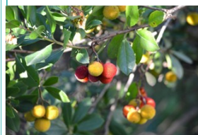
Medronheiro ( Arbutus unedo )

2001, ao abrigo de um projeto do Ciência Viva, desenvolvido por professores do grupo de Biologia e Geologia, foram inseridas diversas espécies da floresta mediterrânica, proporcionadas pela SECIL e pelo Parque Florestal de Monsanto, nossos parceiros no projeto, e germinadas na estufa que se construiu na altura, entre as quais se cita pelo seu significado, o alecrim, a alfarrobeira, a aroeira, o carvalho cerquinho, o folhado, o medronheiro, a murta, o rosmaninho e o zambujeiro. Este projeto teve financiamento do Ministério da Ciência e da Tecnologia, da Câmara Municipal do Barreiro e da Texto-Editora e o apoio Logístico da Secil, do Parque Florestal de Monsanto e da Junta de Freguesia de Santo André.