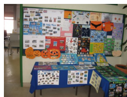
Exposição de trabalhos de Inglês—2º ciclo

Peddy paper - o grupo 230 organizou o primeiro Peddy paper de Matemática e Ciências Naturais destinado aos alunos do 6º ano. Num jogo onde estiveram à prova conhecimentos e capacidades, as equipas participaram com grande entusiasmo tentando obter o maior número de respostas certas no mais curto espaço de tempo. Os vencedores serão conhecidos no início do próximo período.