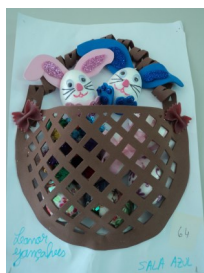
1º lugar - Leonor Gonçalves (sala azul)

As Bibliotecas do AESA desafiaram os alunos do Pré-escolar, 1º e 2º ciclos a decoraram um ovo da Páscoa, utilizando materiais diversos. Os ovos foram elaborados nas salas ou com as famílias e estiveram expostos nas bibliotecas das escolas básicas. A fase de votação já encerrou, tendo sido apurados alguns vencedores. Parabéns a todos!