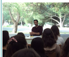
Escritor Bruno Vieira Amaral

Leitura, e dedicou duas semanas de março à motivação para a leitura, num conjunto variado de atividades que promoveram o mágico encontro dos nossos jovens leitores com vários autores e contadores de histórias.