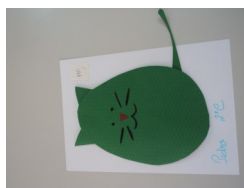
2º lugar - Pedro (2ºC)