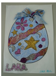
1º lugar - Lara (sala azul)