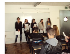
Leitura andariilha - alunas de Lit. Port. 11º H