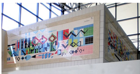
Estação de Coima 2004