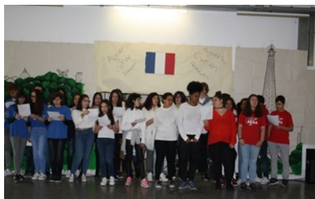
Flash Mob Música Francesa – ESSA – 10º H

no agrupamento, o dia da Francofonia. Entre outros, destacamos um flash mob de música francesa, protagonizado pelo 10ºH, que contou com a colaboração e apoio técnico da Associação de Estudantes e mereceu o aplauso de toda a assistência. Mas o francês e o inglês cruzam-se inevitavelmente. A saber, as histórias francesa e inglesa têm -se misturado desde que o duque normando Guilherme invadiu e tomou posse do reino da Inglaterra